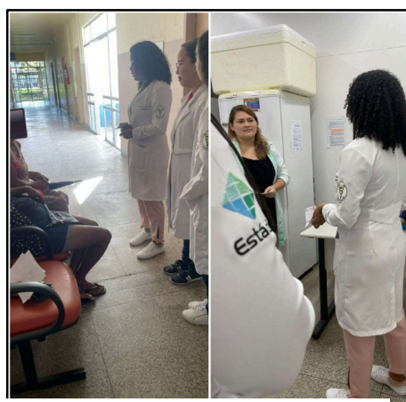
FIGURA 3 - ENTREGA DOS CONVITES

Uma semana antes da execução do projeto, foi realizada uma visita à Unidade Municipal de Saúde (UMS) para a entrega de convites (Figura 3 – Entrega dos Convites) aos profissionais de saúde e ao público presente no local. Essa ação teve como objetivo estimular a participação da comunidade e contribuir para a divulgação da atividade que ocorreria na semana seguinte. Dessa forma, buscou-se promover o jogo de tabuleiro e atrair um maior número de participantes para a intervenção educativa.