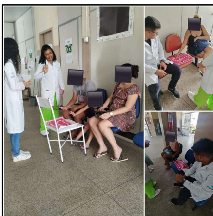
FIGURA 5 - RETORNO À UNIDADE PARA APLICAÇÃO DO JOGO

Durante as partidas, ambos os jogadores de cada rodada receberam um brinde, independentemente do resultado. O brinde consistia em um cartão com um QR code que direcionava para um arquivo em formato PDF, contendo o tabuleiro, as cartas e as regras do jogo, com o objetivo de facilitar o acesso ao material posteriormente.