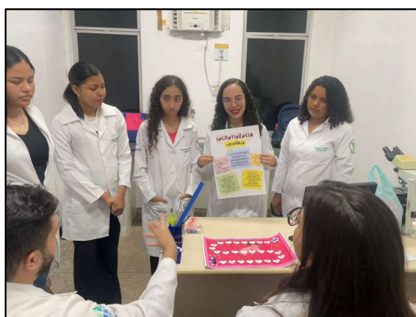
FIGURA 4 - DEMONSTRAÇÃO DA ATIVIDADE EXTENSIONISTA

Antes da aplicação do jogo, foi realizada uma demonstração prévia (Figura 4 – Demonstração da atividade extensionista) para os estagiários do curso de Fisioterapia da Faculdade Estácio. Essa apresentação teve como objetivo testar a dinâmica da atividade e permitir a coleta de críticas construtivas sobre o tabuleiro, as cartas, o cartaz e a abordagem do conteúdo. As sugestões recebidas foram fundamentais para identificar pontos fortes e aspectos a serem aprimorados, contribuindo para o aperfeiçoamento do projeto e garantindo uma melhor execução no momento da intervenção com o público-alvo.