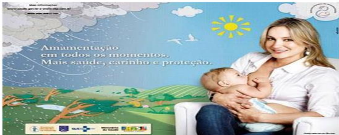
Figura 3: Campanha ministerial que compunha o bloco 3.

Semana Mundial de Aleitamento Materno 2009