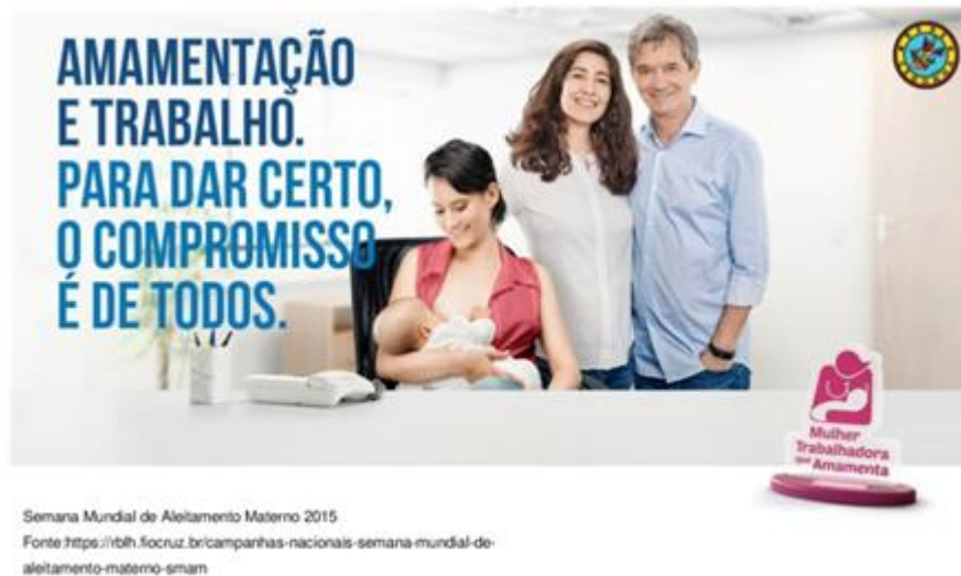
Fonte: Semana Mundial de Aleitamento Materno, 2015.

É o direito de toda mulher ter aquele período para amamentar, é importante pro seu filho. Que é um direito, é um compromisso. (M2)