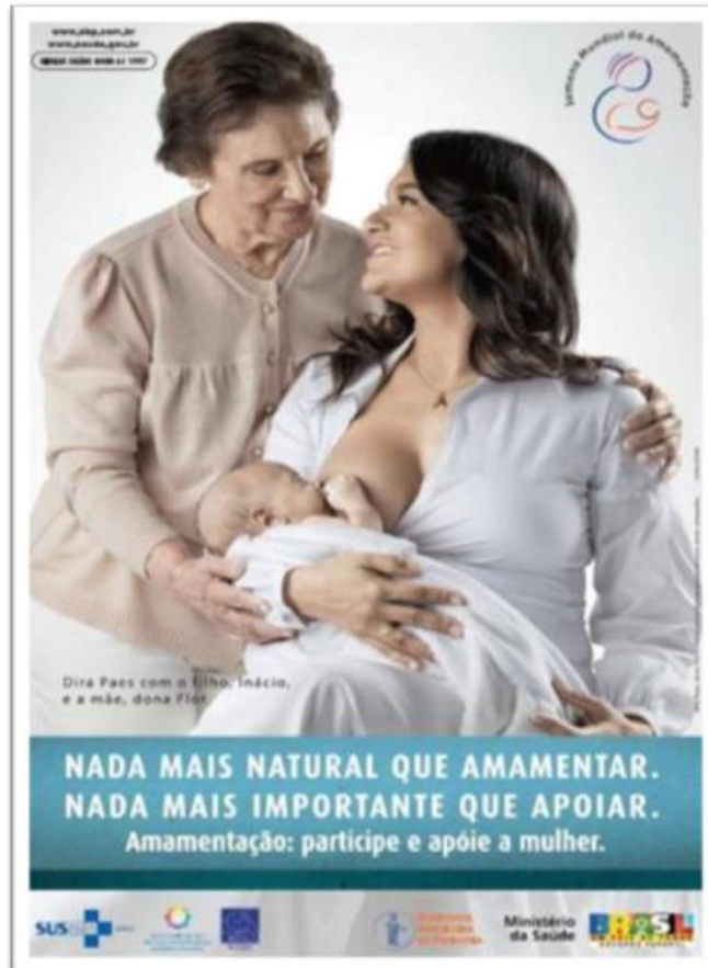
Semana Mundial de Aleitamento Materno 2013