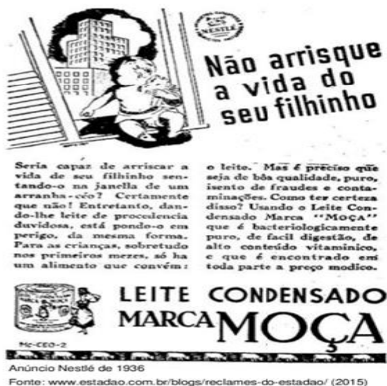
Figura 1: Propagandas que compunham o bloco 1.