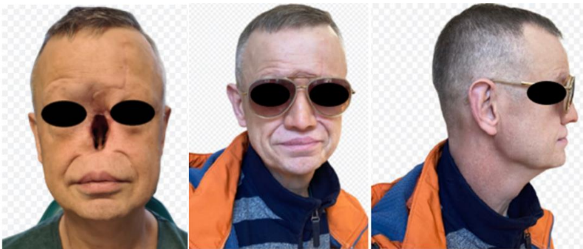
Figura 3: Comparação do efeito da Cirurgia estética. À esquerda paciente em pré-operatório. À direita paciente em pós-operatório (Macías et al., 2020).

A autoestima, por sua vez, consiste na medida dos sentimentos positivos do indivíduo sobre si mesmo. É algo subjetivo porque determina o modo como o indivíduo pensa e se comporta, sendo suas medidas baseadas em experiências individuais e sociais (Macías et al., 2020). Pacientes que, porventura, apresentem tumores dos seios nasais e paranasais, perdem capacidades funcionais como fala, respiração, mastigação e deglutição (Macías et al., 2020). Eles podem, então, recorrer à cirurgia plástica que abarca em seu cerne a manutenção da vida, função e estética (TAMAŞ et al., 2018). A cirurgia reconstrutiva após tratamento cirúrgico de neoplasias na região de cabeça e pescoço é sempre um desafio. Muitos fatores são responsáveis pelo sucesso da reconstrução (Macías et al., 2020). A utilização de implantes ancorados pelos cirurgiões promoveu uma recuperação funcional e estética da neoplasia, surpreendendo tanto o paciente quanto o cirurgião, que elogiaram muito o efeito cosmético da prótese, que permitiu ao paciente retornar à plena função social, como mostra a Figura 3 (Macías et al., 2020).