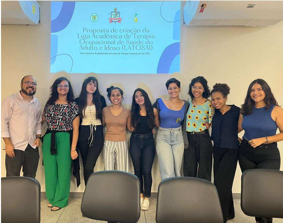
Foto: Diretoria e Orientador na Assembleia Geral da LATOSAI (março/2024)

Acadêmica, possibilita não somente a reflexão sobre o ser profissional e o direcionamento vocacional como também mostra para a Universidade e sociedade algumas das diversas perspectivas sobre o processo de formação do acadêmico, que estuda, aprende e dialoga sobre a especialidade da Liga.