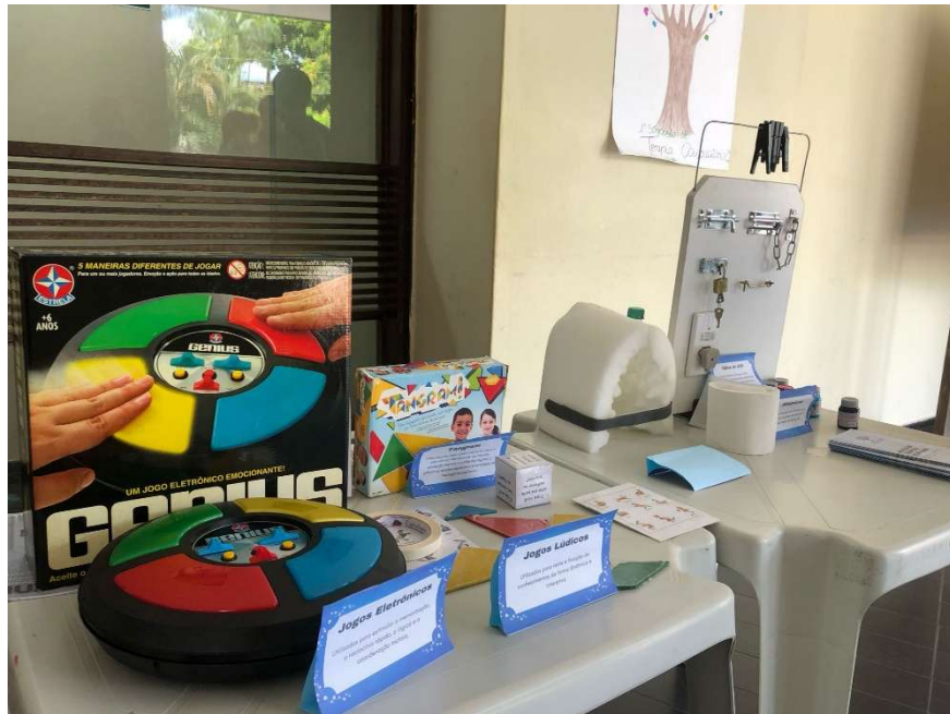
Foto: Recursos terapêuticos disponibilizados para a ação (maio/2024)

possibilitou que a Liga pudesse realizar uma ação em educação em saúde acerca atuação do Terapeuta Ocupacional no contexto hospitalar no que tange os dois públicos alvos da Liga, além disso a ação contou com a ajuda a Comissão Organizadora do evento que disponibilizaram alguns recursos que se utiliza durante o tratamento terapêutico ocupacional hospitalar para que a Liga pudesse utilizar e explanar para o mais sobre a temática com a comunidade (médicos, residentes, profissionais da saúde, usuários do hospital e acadêmicos).