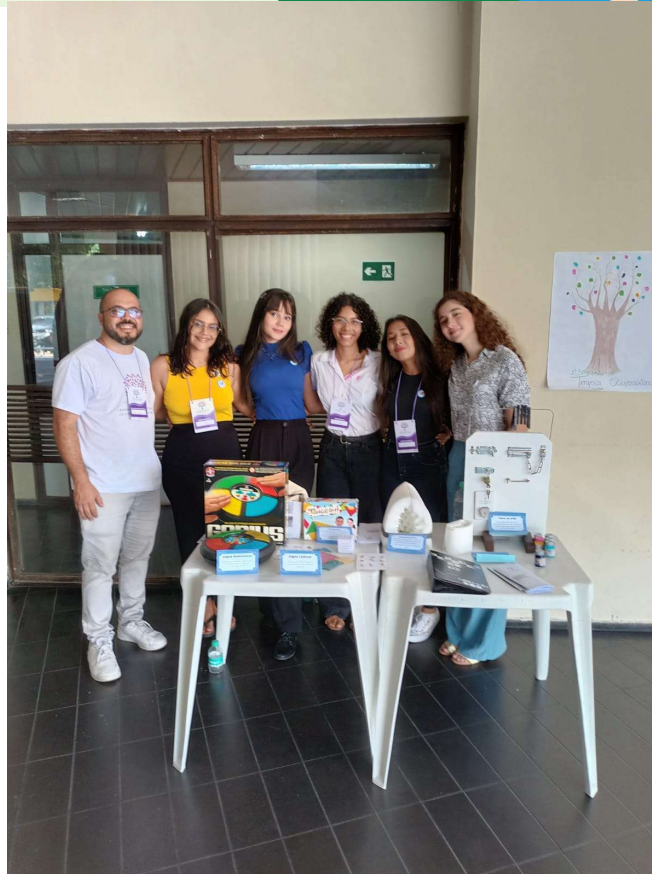
Foto: Docente Orientador, Diretoria e ligante da LATOSAI (maio/2024)

Ademais, a ação contou com um momento muito especial que foi uma pintura construtiva de uma árvore de digitais, ou seja, cada pessoa que parasse para ouvir um pouco do que a Liga havia preparado poderia colocar sua digital em uma tinta de cor e ir moldando as folhas da árvore de modo coletivo até chegar ao produto final.